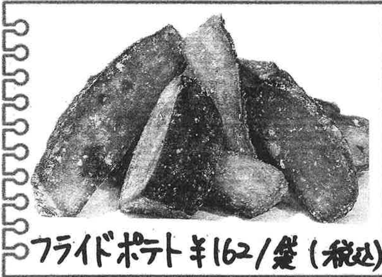
フライドポテト ¥162/袋 (税込)

今回のおすすめは「フライドポテト」です! さつまいもバージョンの「フライドポテト」は、 お芋を少し太めにカット。油で揚げる 前に1度じっくり蒸しているのので甘さが 最大限に引き出され、フライした時に 衣のカリッとした食感とお芋のしっとり とした食感を味わえます。お塩だけの シンプルな味つけは甘いものが苦手な 方にもおすすめ! 土日祝日の限定販売 になります。ぜひ一度ご賞味下さい!