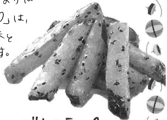
ごまスティック ¥324/1パック (税込)

「アーモンドスティック」「ごまスティック」は、ほてふあーでも売りがトップを争う大人気商品です。毎日お店で手作りされるこれらの2品は、食べやすくスティック状にカットしたさつまいもを素揚げして、ほてふあーオリジナルのバウバウアメを絡めました。「アーモンドスティック」のトッピングにはアーモンドと黒ごまで、フランクのようなナッツの香ばしさとお味の甘さを感じられる、洋菓子のよ様な美味しさです。「ごまスティック」は、