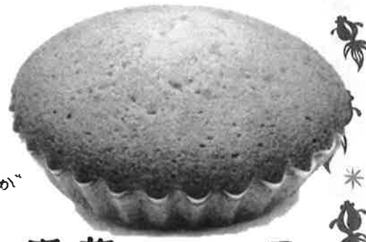
お芋のマドレーヌ 単品 ¥145 (税込) 6コ箱 ¥870 (税込)

もう一品は、「お芋のマドレーヌ」のバター風味が豊かに香る、お芋の細かいしっとりとした生地には仕上げました。中にはほちみつ入りの甘い蜜でじっくりと煮こんだたまごがたっぷり入っています。たくさん遊んでお腹がすいたら、ぜひこの商品をお召し上がり頂きたいです!どちらも日持ちがします。レジャーのお供にはもちろん、お盆に帰省する時、お土産としてもお使い頂ける商品です。この機会にぜひお試しください!!